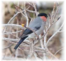
(ウソ スズメ目 アトリ科 ウソ属)

ホントのようでウソもある だからウソのようでホントもある ホントかウソか一人の場合は自分で決めるが 普通が一番強い人の云う通りになる