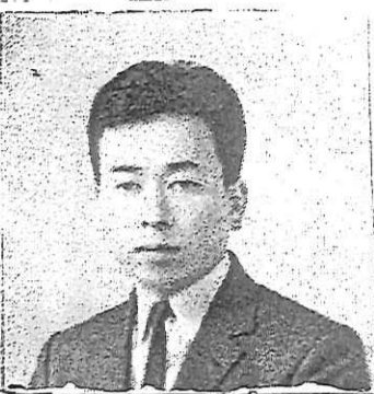
2代目社長 先代の長所をいかし短所を半分にした 1部上場企業となる