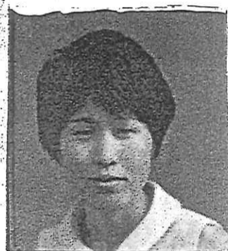
2代目社長夫人 先代より美人である