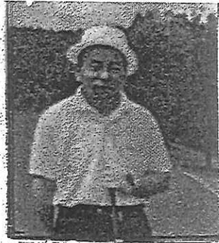
先代社長 今井ゴム創設

っていた頃です。その頃の自動車はかなり性能がよくなり（といっても現在のようには空を飛んだり水に浮かんだりすることはできません）道路は高速道路でさえ時速100kmしか走れないのに180kmもスピードの出る車を国が許可していたら、普通の道路は精々4、50kmなのによ。出したく