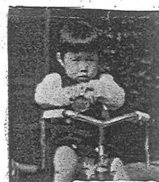
孫八 大きくなったら高級官僚になるんだ

赤マキガミ青マキガミ白マキガミ黄マキガミと早口で3度言っても許しては貰えず、トホホと泣ける程お金を取られるんだって。でもそのお金はオマワリサンが自分の家に持って行って貯金してしまっただけじゃありません。ホントはそうしたいかも知れないけれど、それは出来ないでチツとも嫌しそうな顔はしないんだ。聞いたらお国のために使ったんだって。国というのはいくらお金があっても足りないんだ。底抜け袋でいろいろ名目を集金するんだって。だからいっぱい罰金を払った人は結局お国の役にたったことになり御祖父さんは随分と国にためになったんだって。変なの。国や政府がやっていることで変なお話